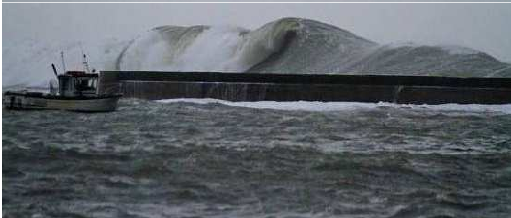
France...Morbihan à Ploemeur