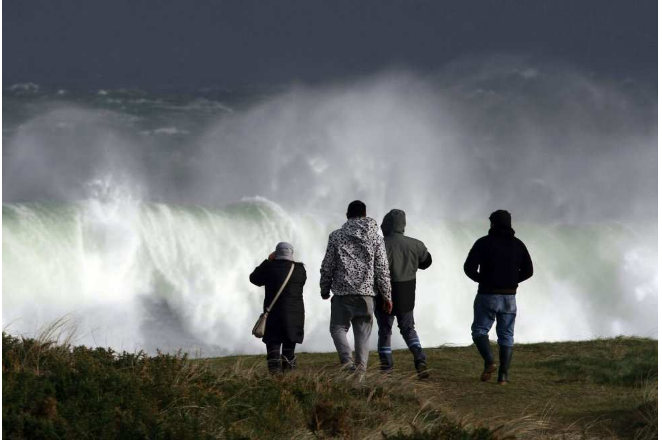
Espagne...Plage de Ponzos de Ferrol