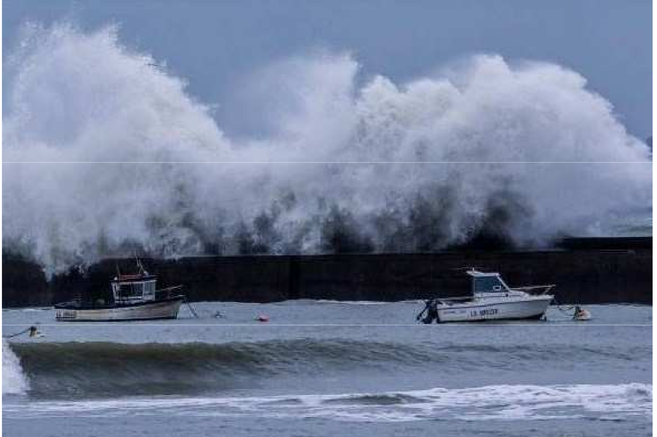
France...Morbihan à Ploemeur autre vague