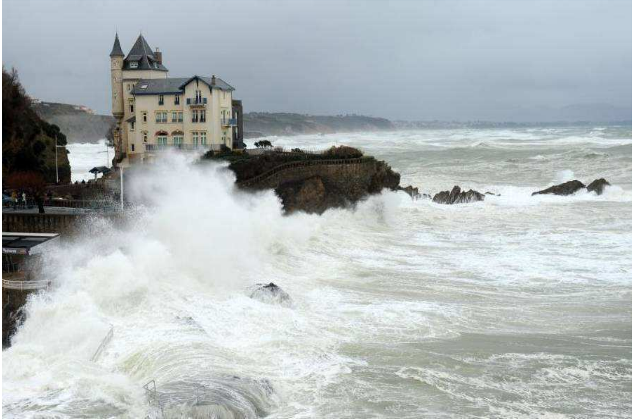
France...Pyrénées-Atlantiques à Biarritz