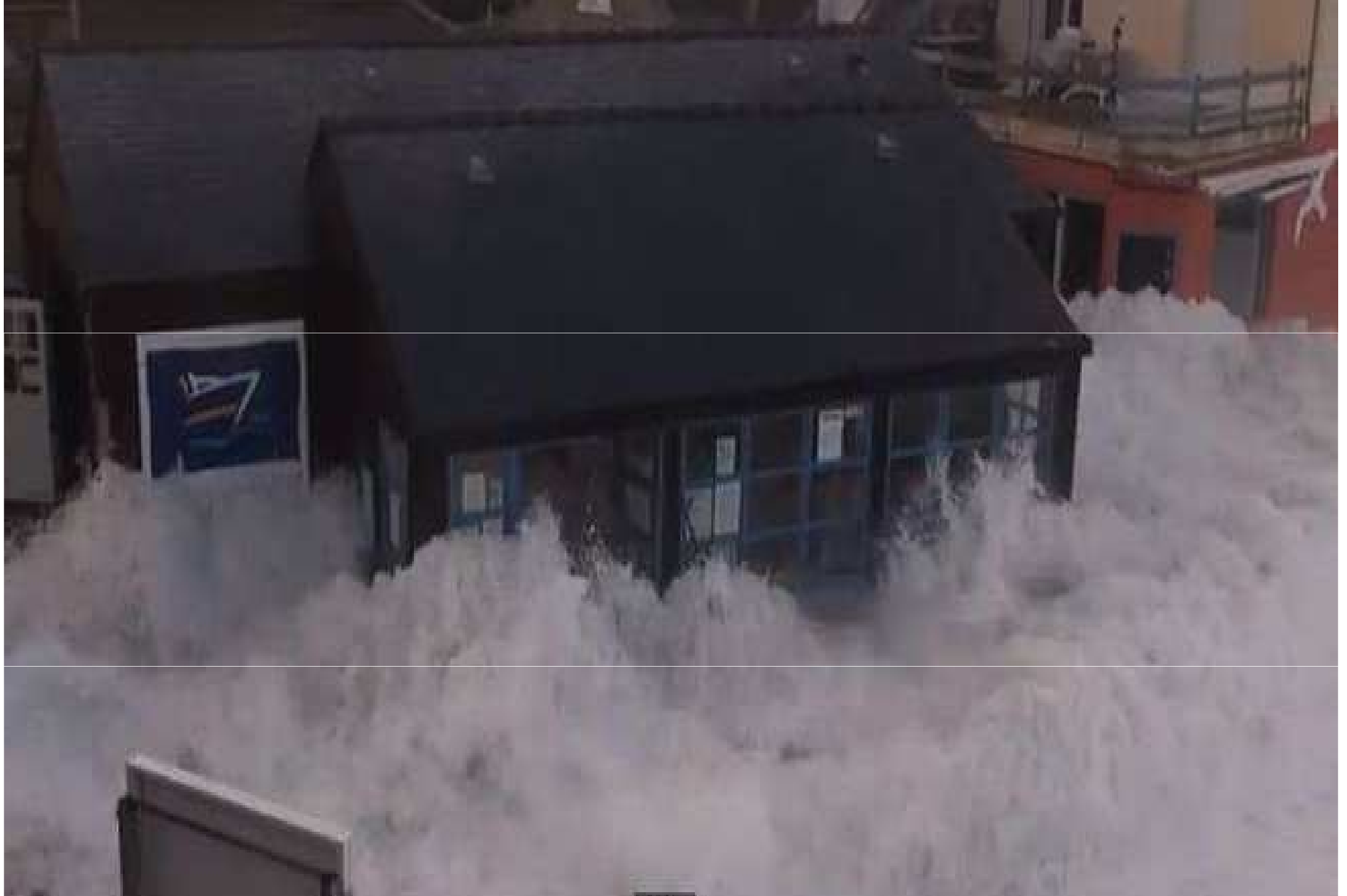
France...Finistère... Ile de Sein ( la gare maritime est ravagée)