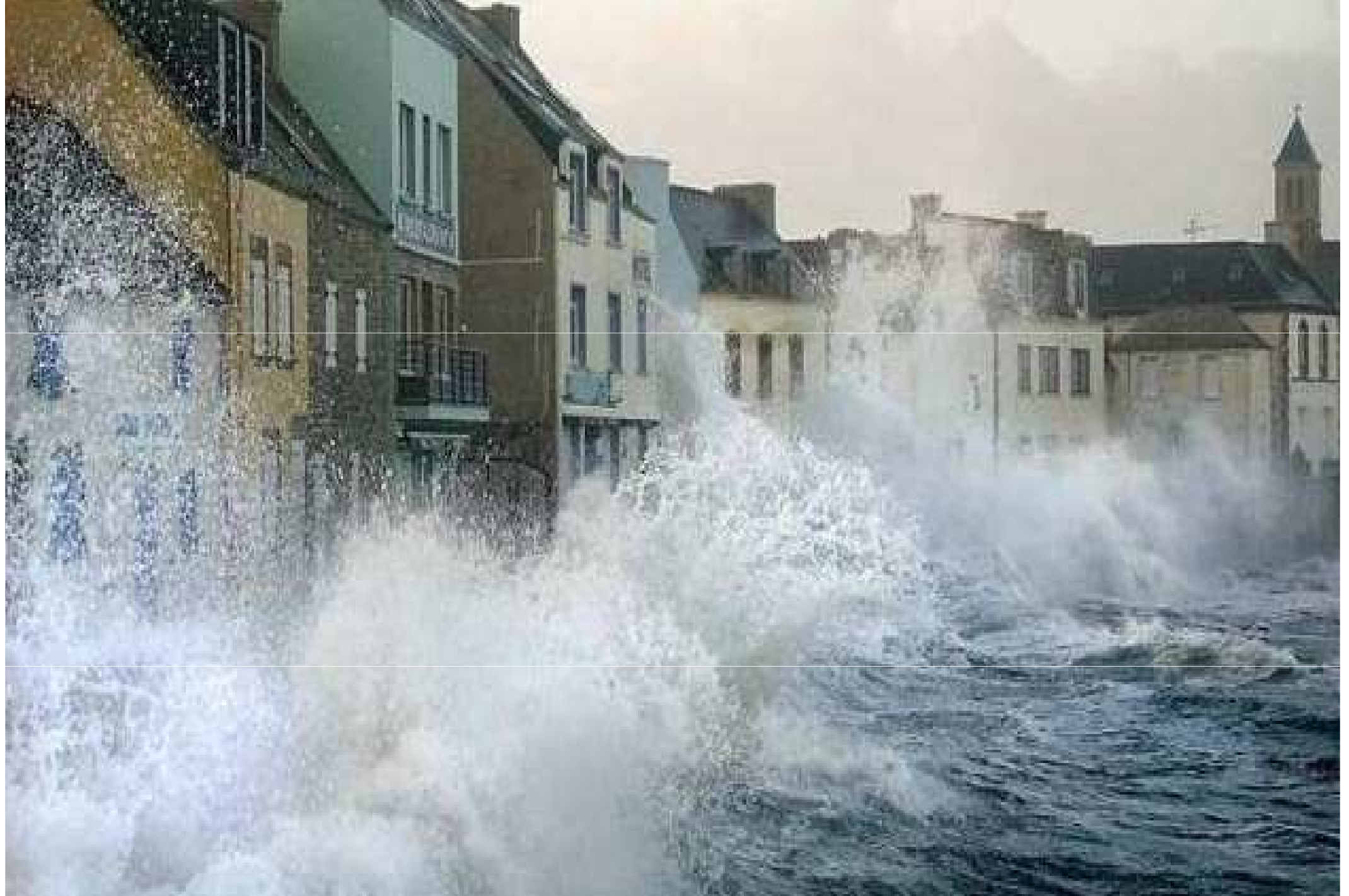
France... Finistère ...ile de Sein....le quai des Paimpolais