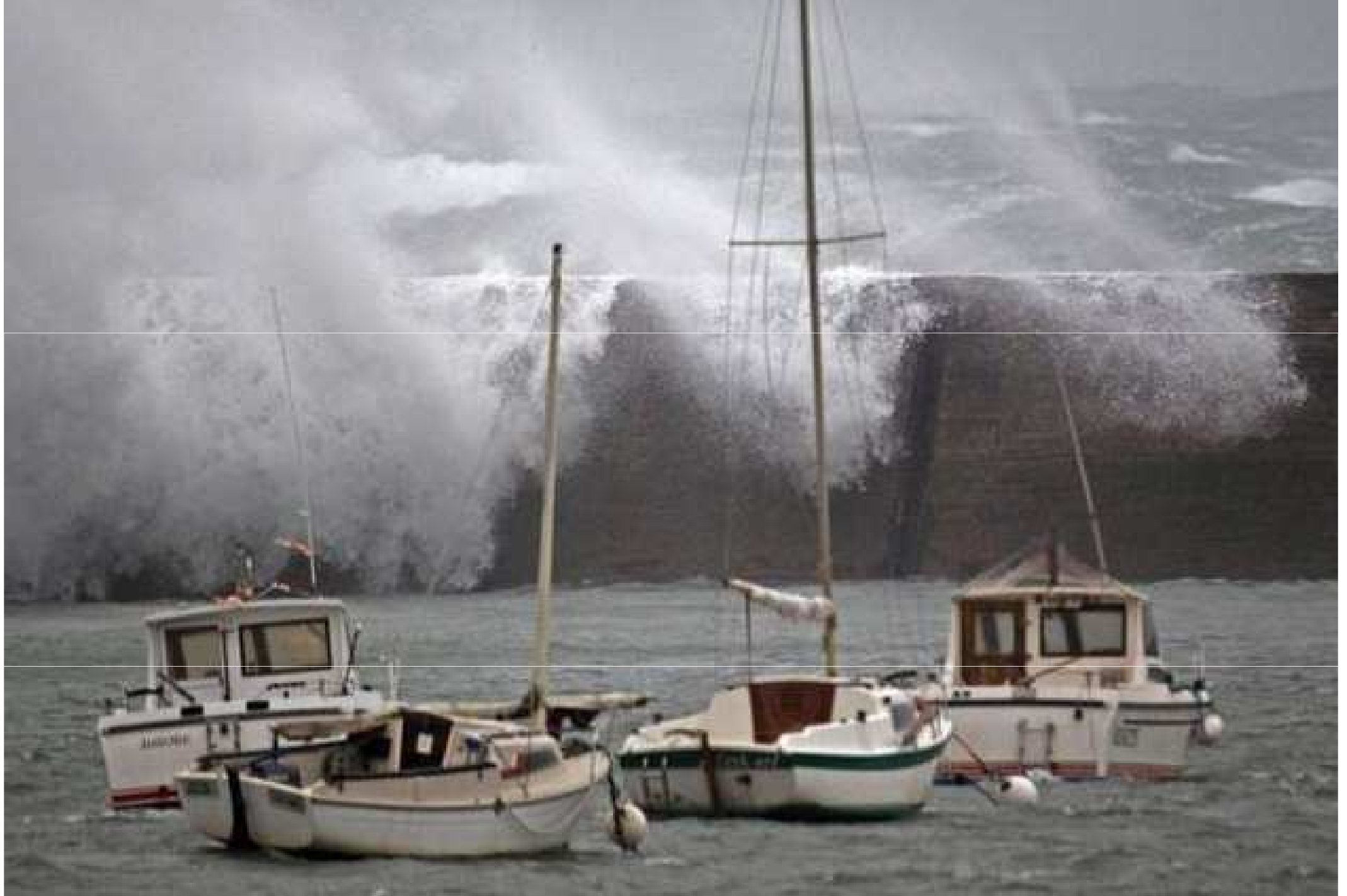
France...Finistère...Vague sur la digue d' Esquibien