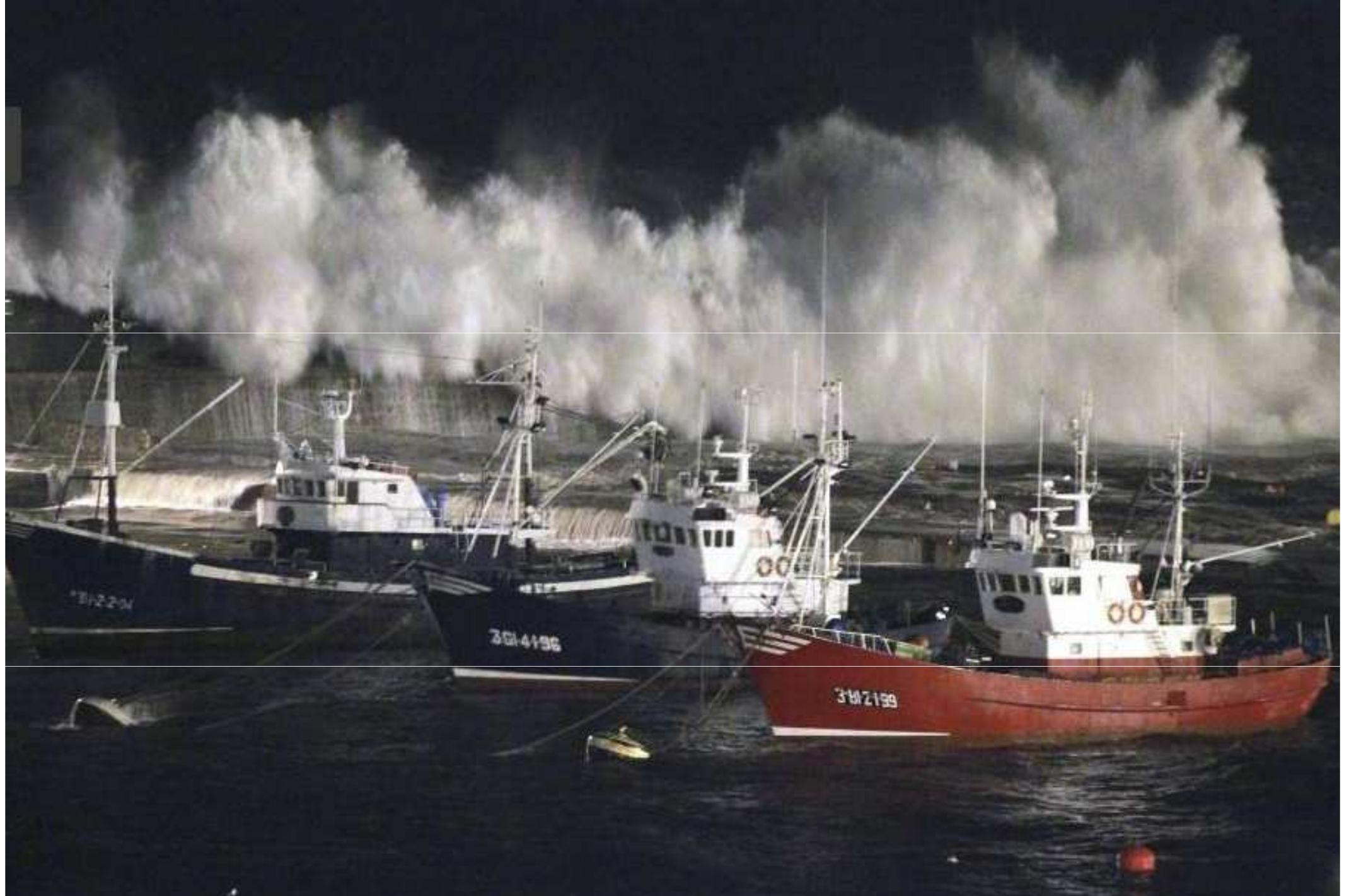
Espagne...Port de Berméo