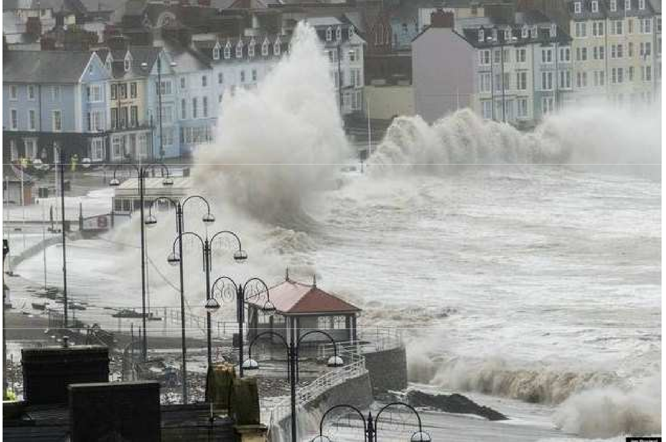
Grande-Bretagne....Pays de Galles