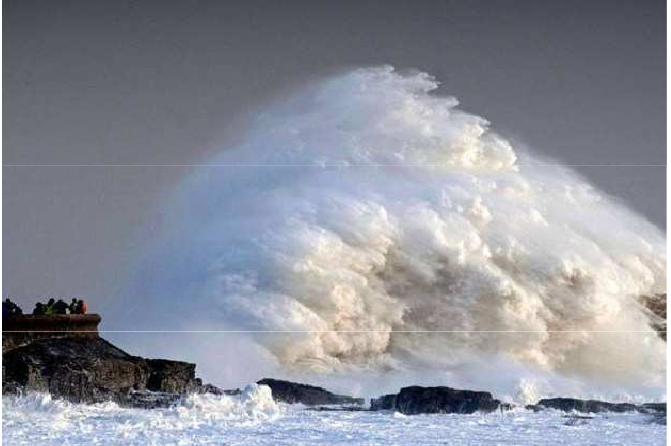
Grande Bretagne ...Porthcawl