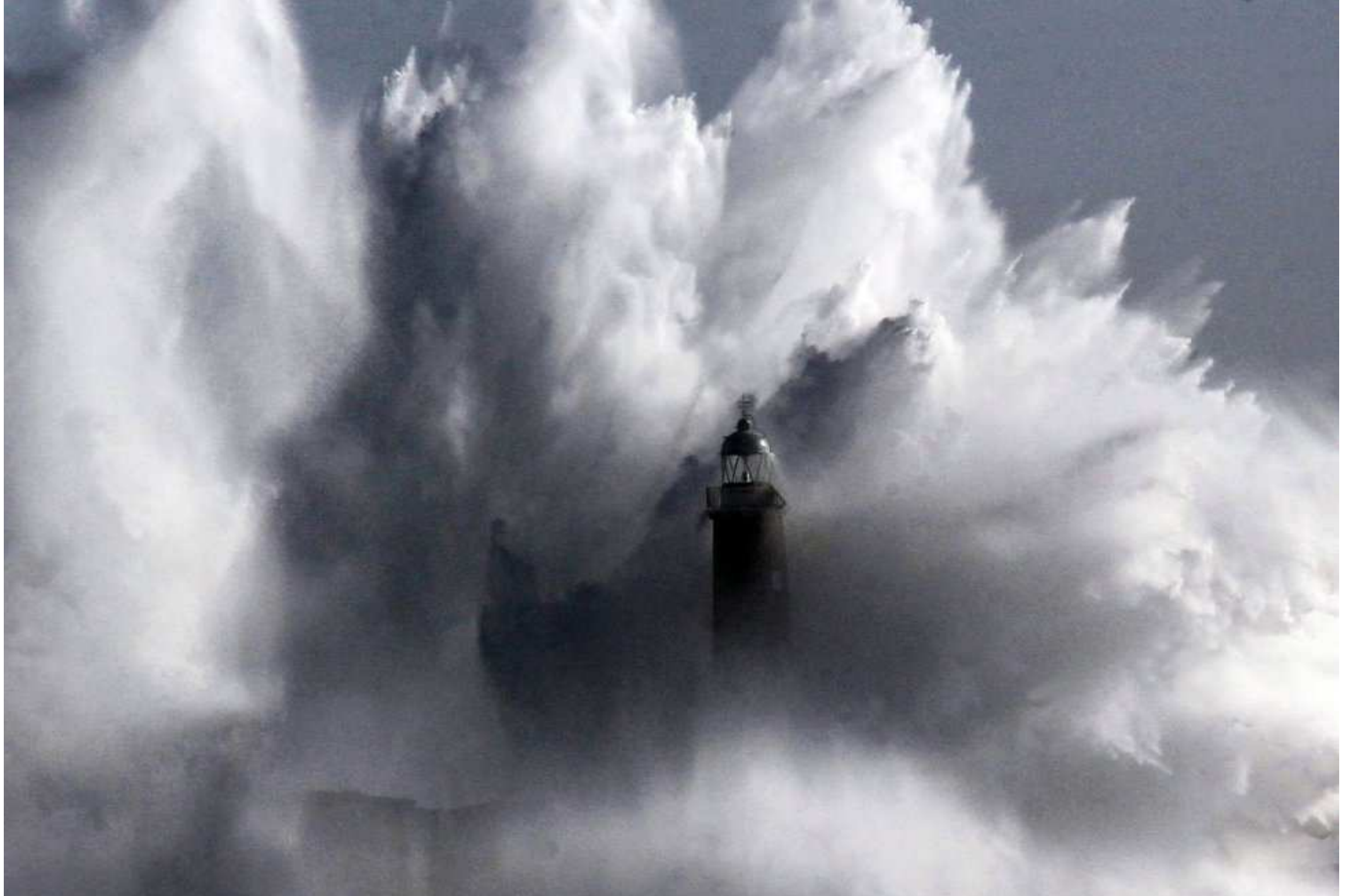
Espagne ...Ile de Mouro à Santander