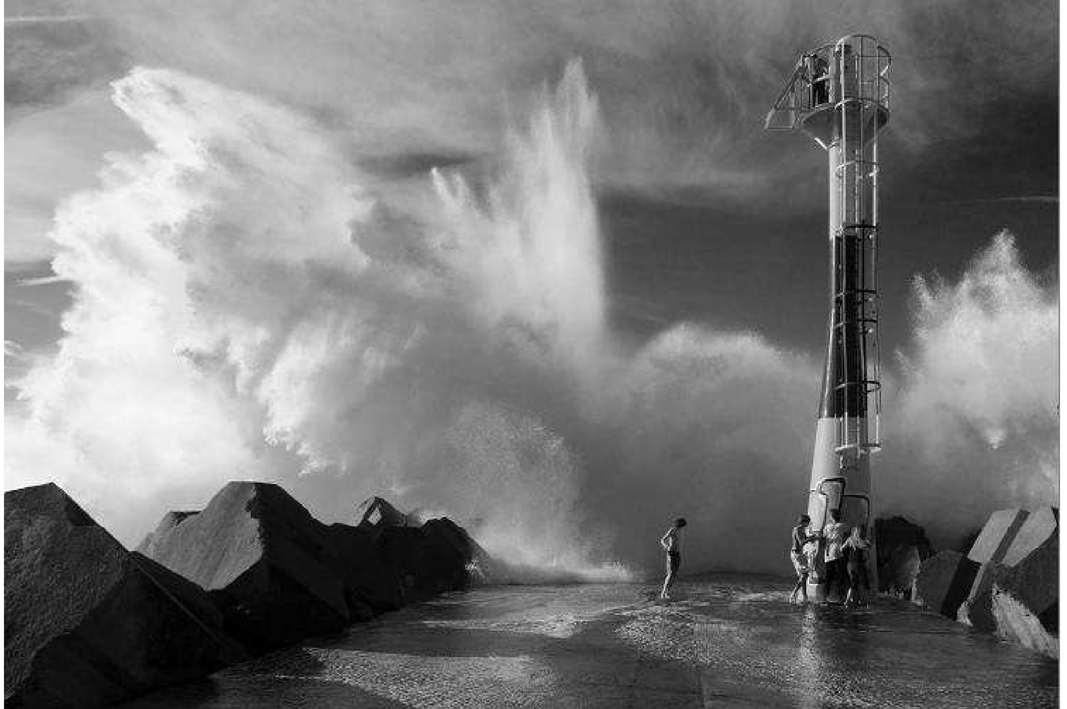
France...Pyrénées-Atlantiques à Anglet