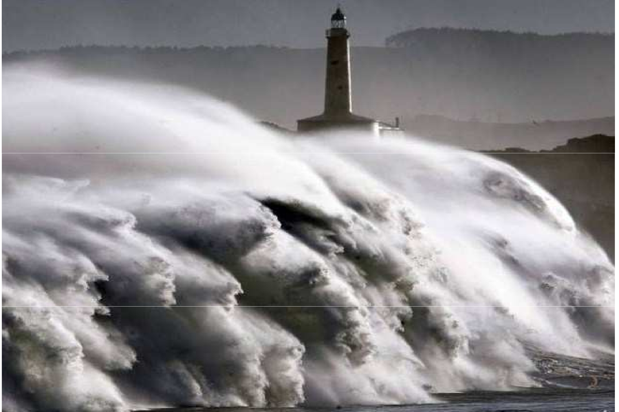
Espagne... Entrée de la Baie de Santander