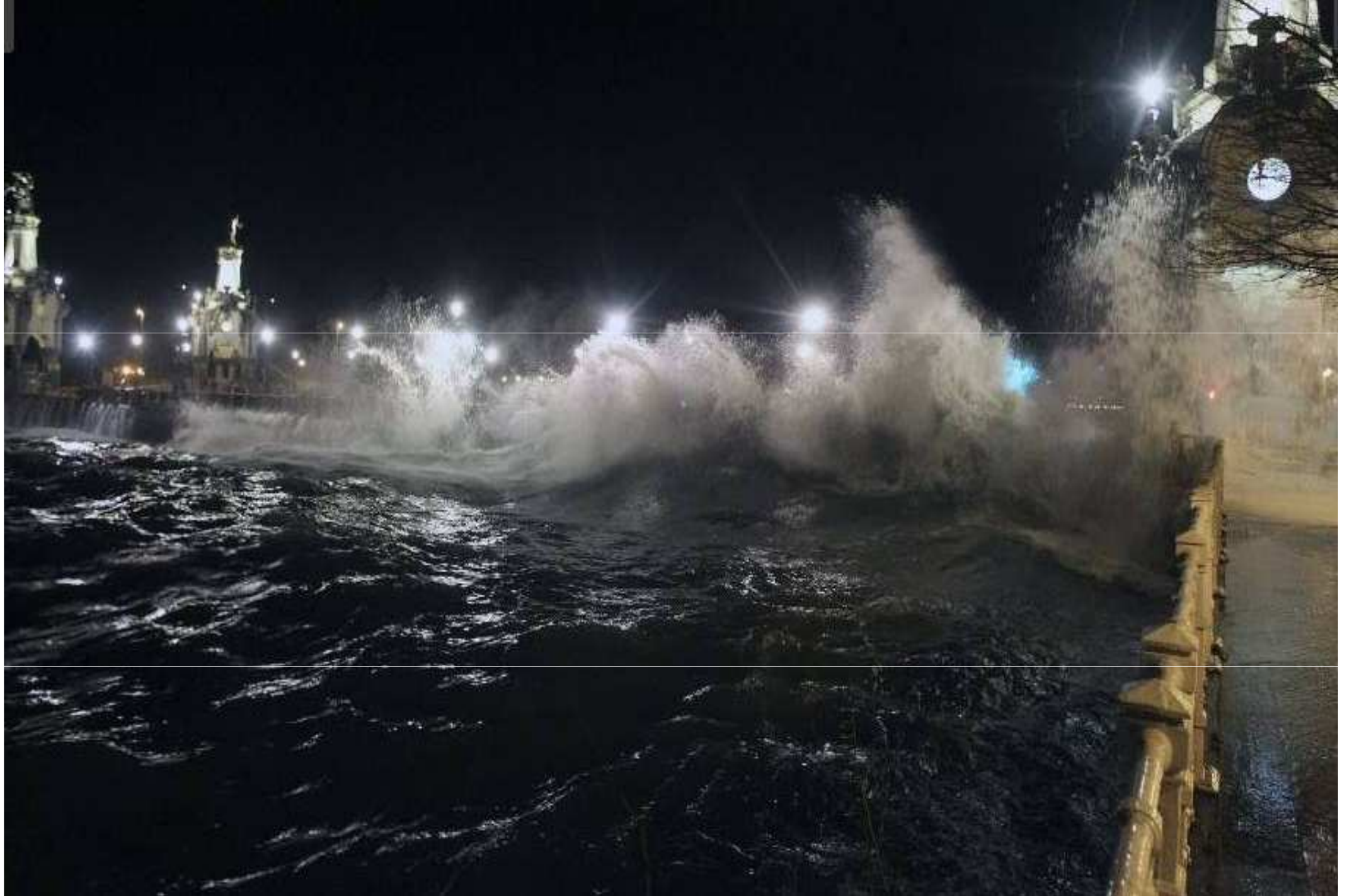
Espagne... Santa Catalina à San Sébastian