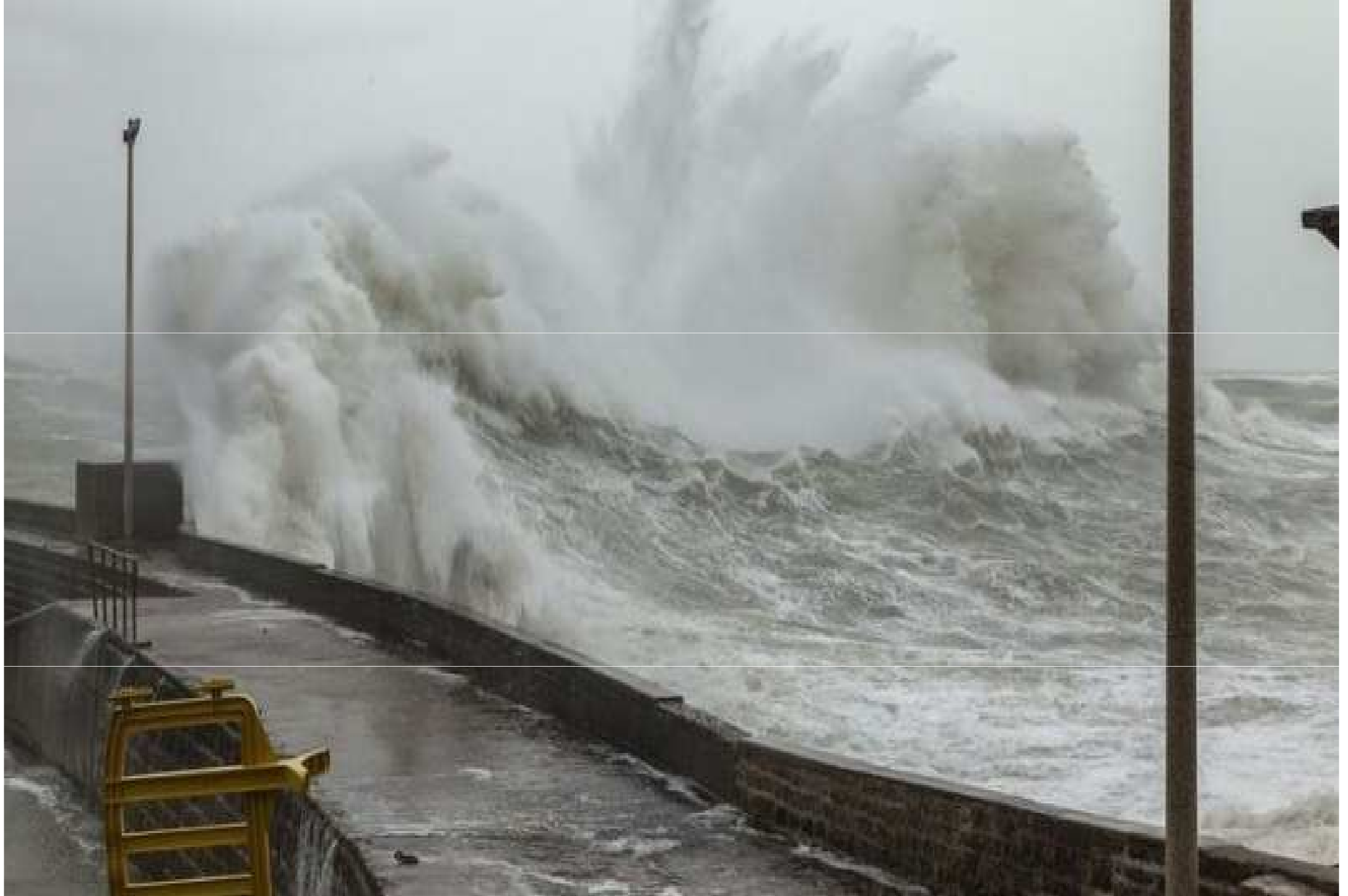
France...Morbihan à Lomener-Ploermeur