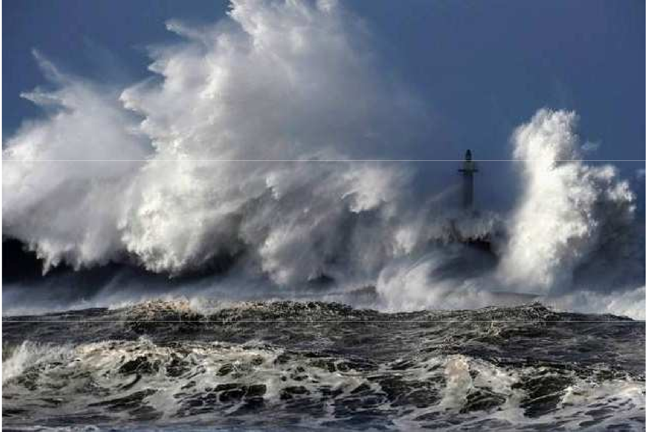
Espagne...San Esteban de Pravia