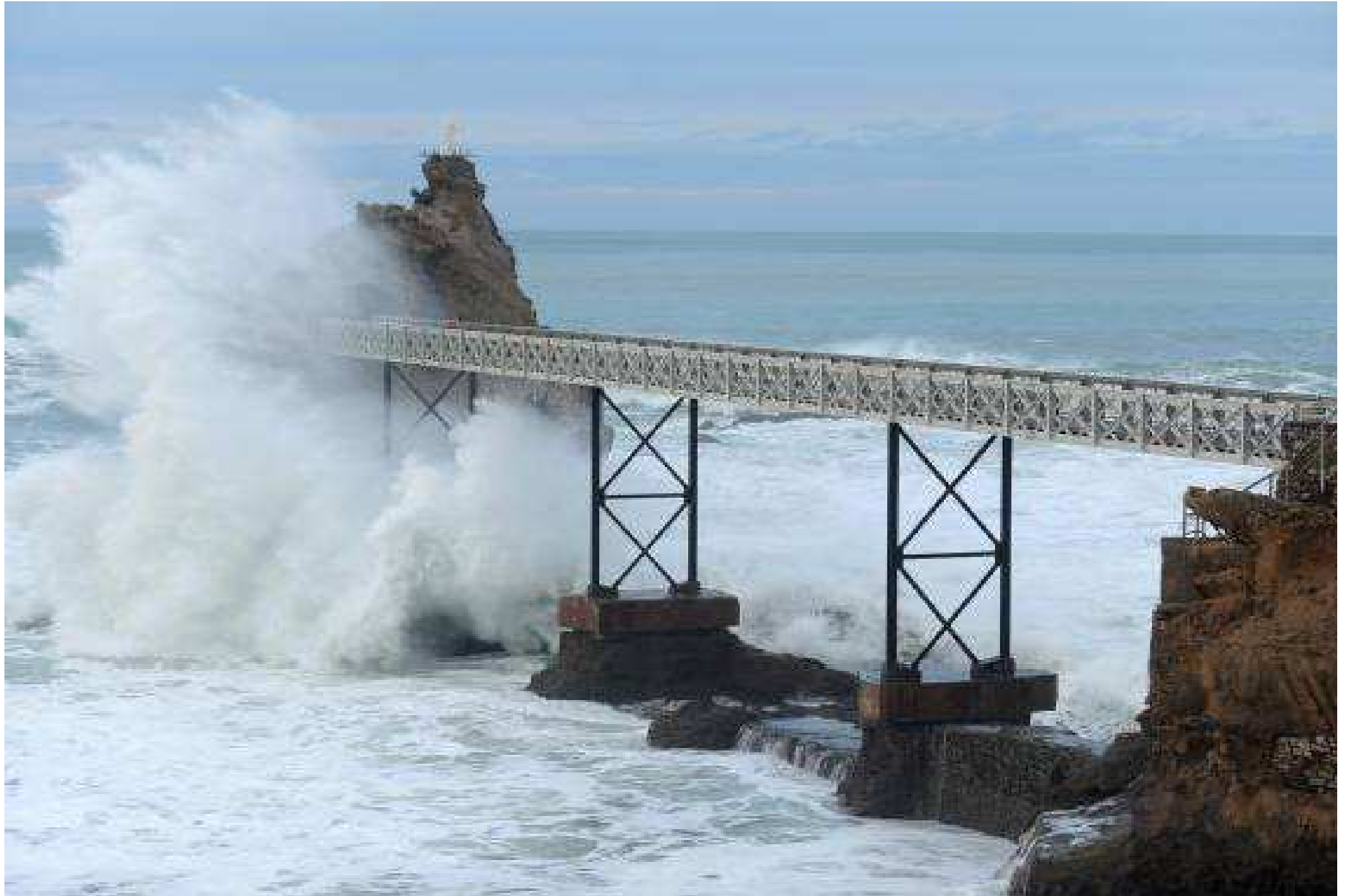
France...Pyrénées-Atlantiques...à Biarritz...le Rocher de la Vierge