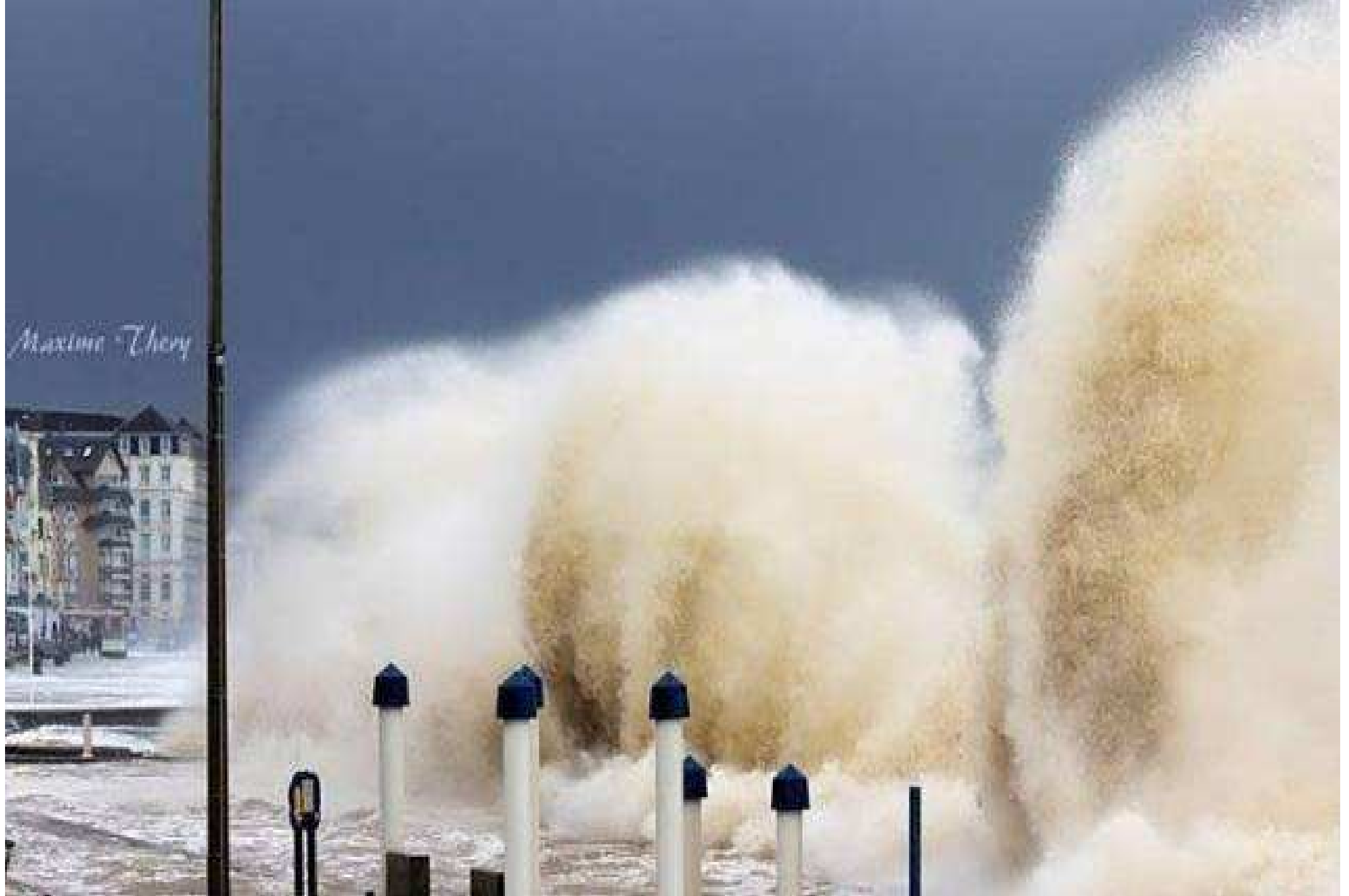
France... Nord -Pas-de-Calais à Vimereux