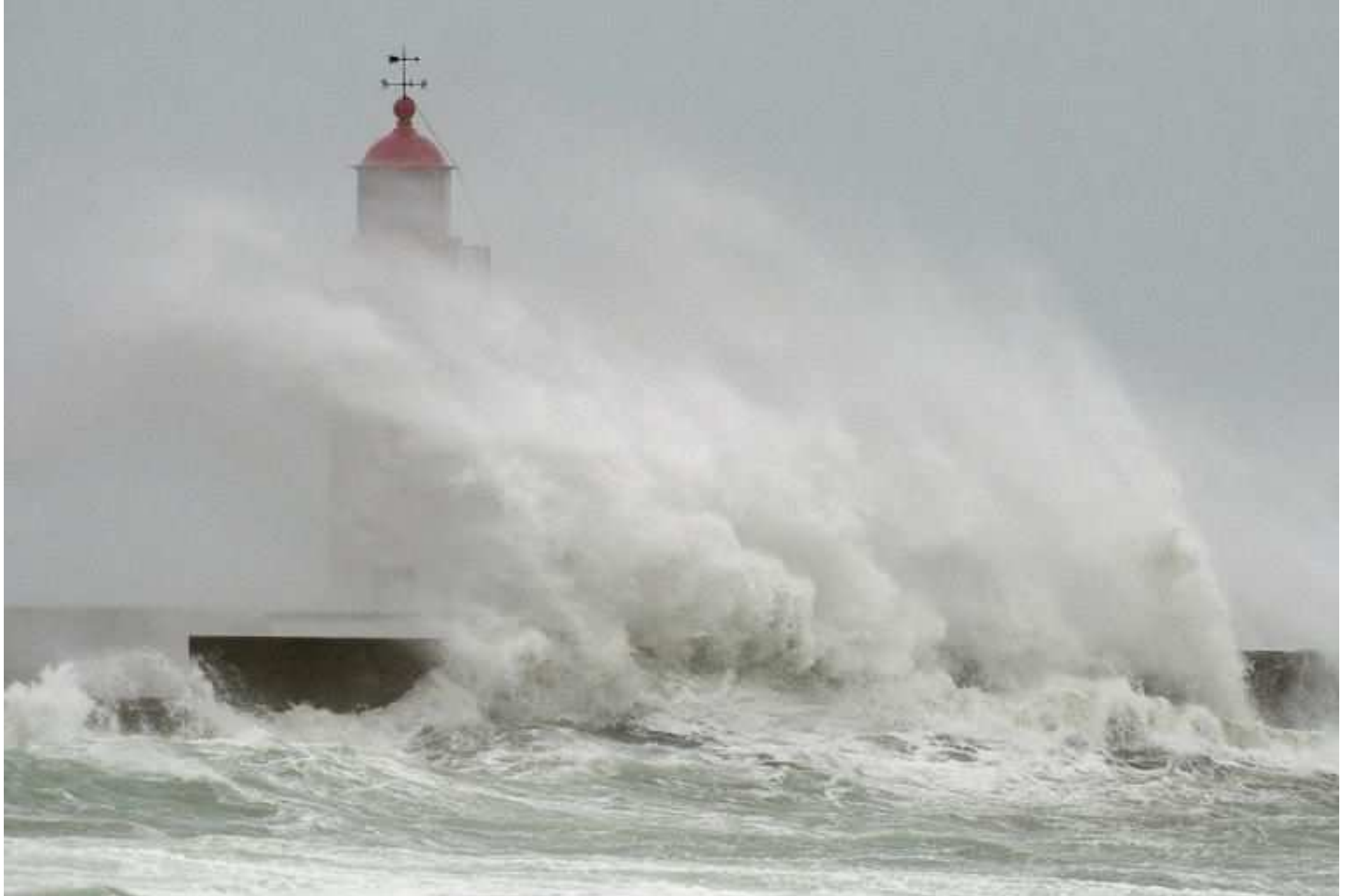
France...Finistère au Guilvinec