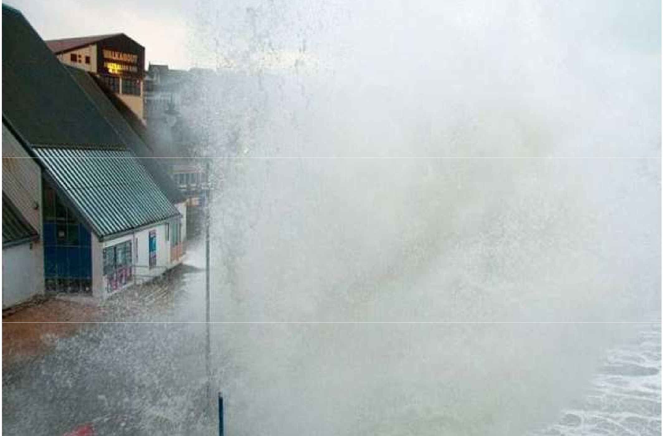
Grande-Bretagne...à Towan Beach