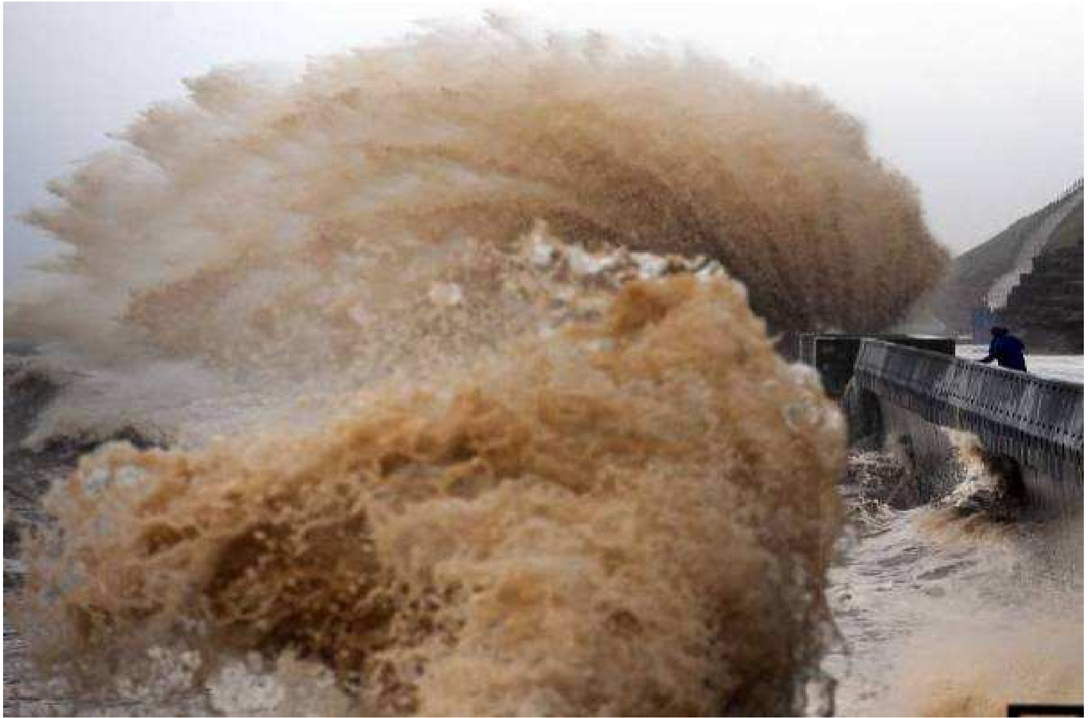
Grande-Bretagne... à Dorset